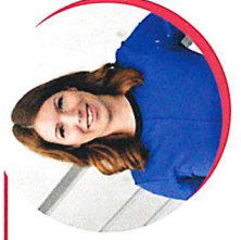
Dr. Anna Christmann Beauftragte der Bundesregierung für Digitale Wirtschaft und Start-ups, BMWK