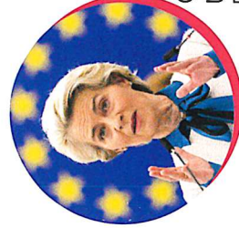
Grußwort von Ursula von der Leyen Präsidentin der Europäischen Kommission