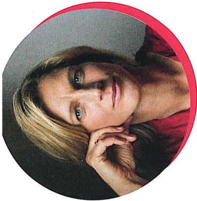
Prof. Dr. Maja Göpel Politikökonomin, Transformationsforscherin und -beraterin, Nachhaltigkeitsexpertin