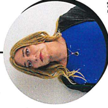
Tessa Ganserer Bundestagsabgeordnete Bündnis 90/ Die Grünen

Was früher einheitlich war, ist heute vielfältig – oder soll zumindest vielfältiger werden. Diversity ist in aller Munde, doch was bedeutet das in der Praxis? Wie können wir mehr Vielfalt wagen – wie stoßen wir Veränderung an? Wir wollen darüber sprechen, wie es ist, anders als die Mehrheit zu sein und Dinge anders zu machen , als sie immer gemacht wurden.